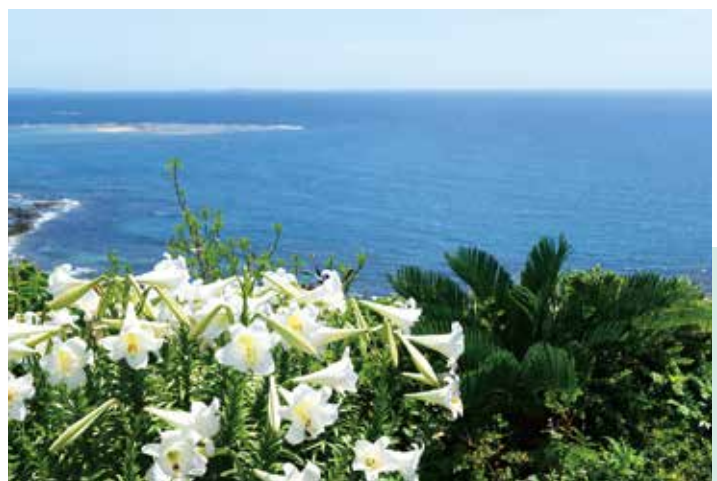
表紙写真/青い海と白いユリの花